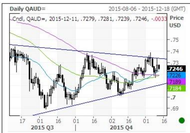
澳元/美元汇率走势图