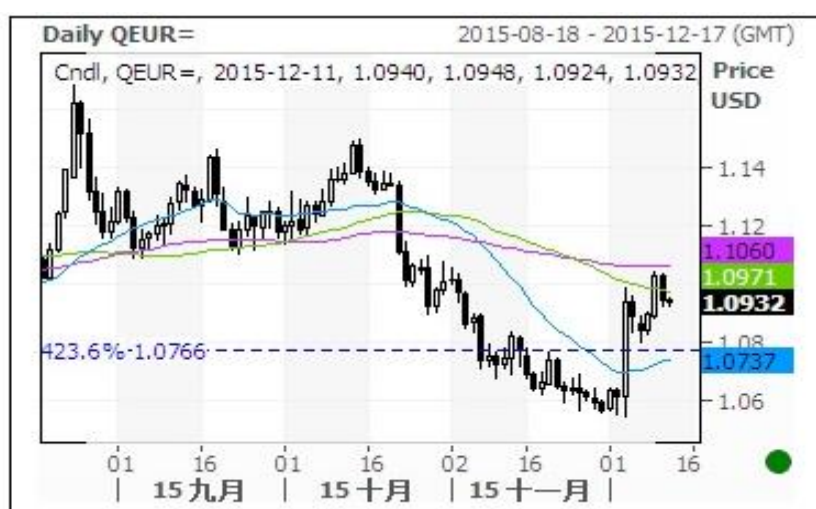
欧元对美元即期汇率走势图