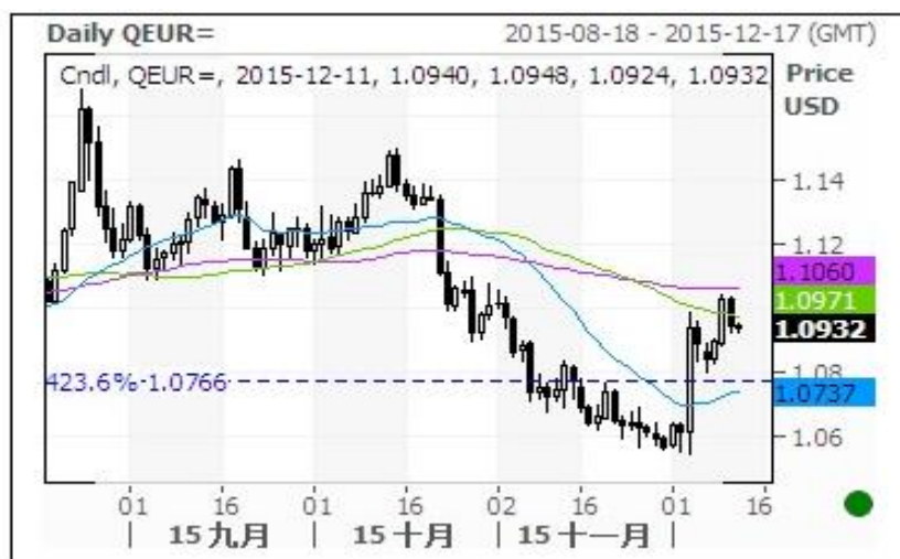
欧元对美元即期汇率走势图