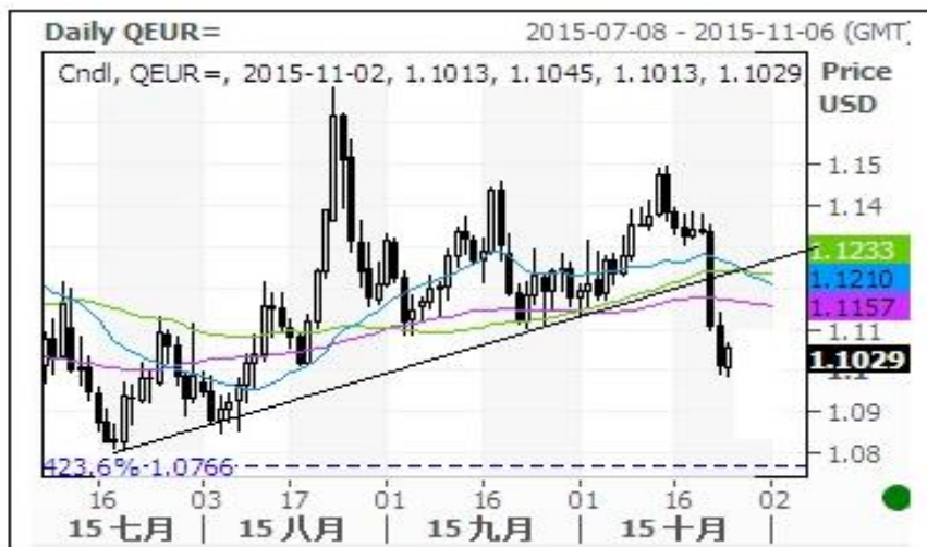
欧元对美元即期汇率走势图

本周欧元对美元汇率下跌，跌至 120 日和 200 日均线以下，欧元的下跌趋势再次形成，目前短暂跌破前期欧元的上升趋势线，如确认跌破该趋势线将进一步下跌。