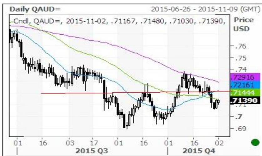
澳元/美元汇率走势图

本周澳元对美元下跌，逼近 60 日均线 and 前期双底的颈线位，如确认跌破该点位（0.72 附近），可能将进一步下跌。