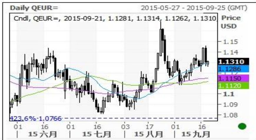
欧元对美元即期汇率走势图

近期欧元对美元汇率再度下跌至 200 日均线以下，近期欧元对美元汇率围绕 200 日均线震荡，表明近期欧元走势不明，如确认站上 200 日均线，欧元可能近期反弹力度较强。