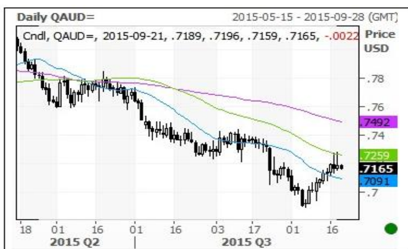
澳元/美元汇率走势图

本周澳元对美元在触及 60 日均线后再度下跌至 0.70 附近，前期低点为 0.6900，如确认跌破该点位将进一步下跌，反之则将反弹。