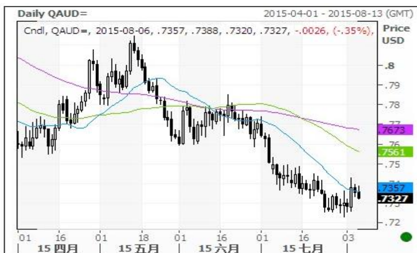
澳元/美元汇率走势图

本周澳元对美元再度打开下跌行情。10 日、20 日均线均呈空头排列，后市下跌走势受制于月线级别的上升趋势线下轨 0.71，如跌破该点位将进一步下跌。