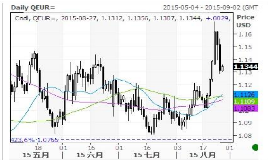
欧元对美元即期汇率走势图

本周欧元对美元汇率并未向上有效突破了 200 日下跌的均线，表明欧元长线看跌的走势并未改变。